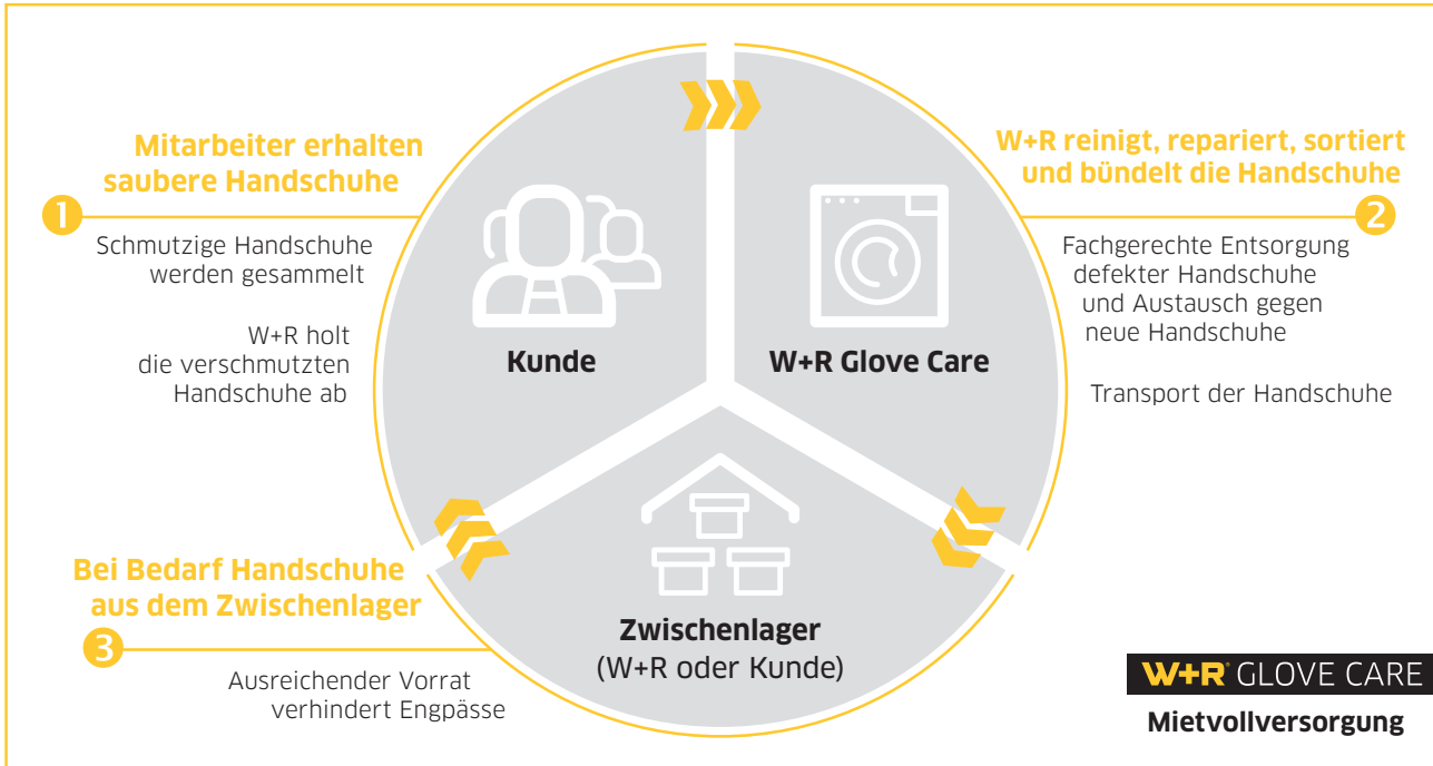
Ablauf der Mietvollversorgung durch W+R GLOVE CARE

Neben der Kostenersparnis gegenüber dem Neukauf entfällt bei der Mietvollversorgung auch der logistische und personelle Aufwand für Anschaffung und Lagerhaltung. Die damit betrauten Mitarbeiter stehen für andere Aufgaben zur Verfügung.