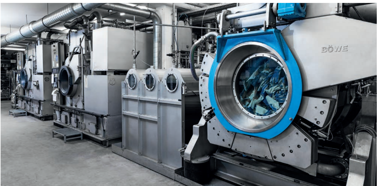
Ein Blick in die Industriereinigung für Handschuhe von W+R Glove Care in Metzingen.

Irreparable Handschuhe werden ausgelistet, so hat das Unternehmen stets einen Überblick über den Bestand.