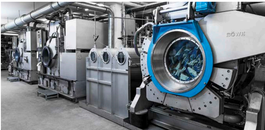
Ein Blick in die Industriereinigung für Handschuhe von W+R Glove Care in Metzingen.

Irreparable Handschuhe werden ausgelistet, so hat das Unternehmen stets einen Überblick über den Bestand.