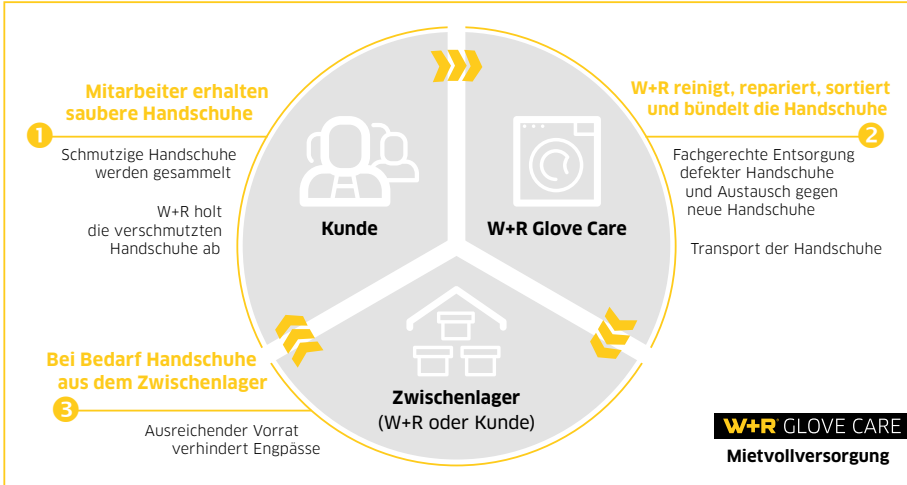
Ablauf der Mietvollversorgung durch W+R GLOVE CARE

Neben der Kostenersparnis gegenüber dem Neukauf entfällt bei der Mietvollversorgung auch der logistische und personelle Aufwand für Anschaffung und Lagerhaltung. Die damit betrauten Mitarbeiter stehen für andere Aufgaben zur Verfügung.