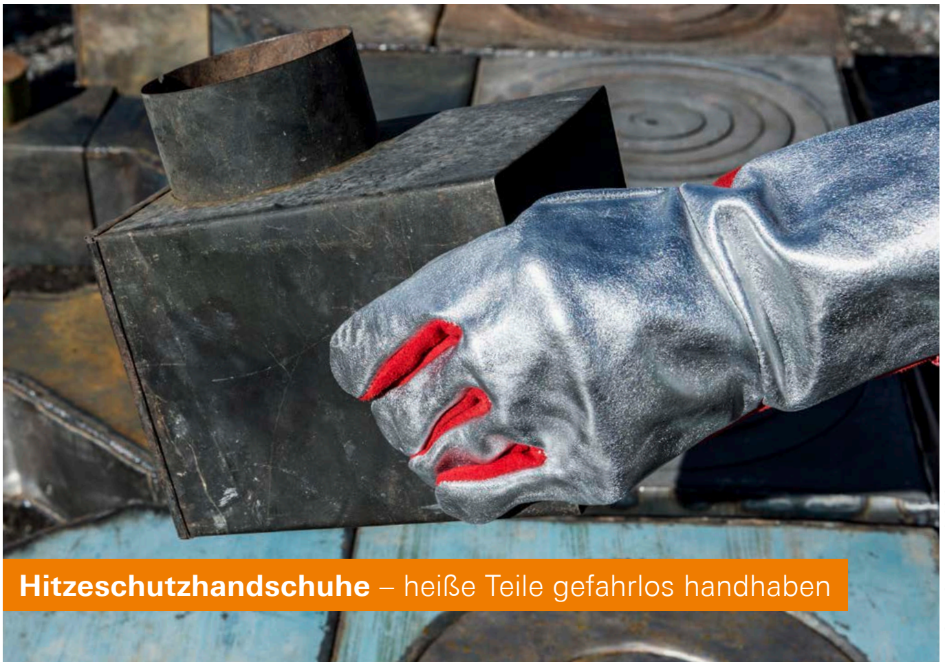
ALUSTAR 2 (Art.-Nr. 2798-011)

Hitzeschutzhandschuhe – heiße Teile gefahrlos handhaben